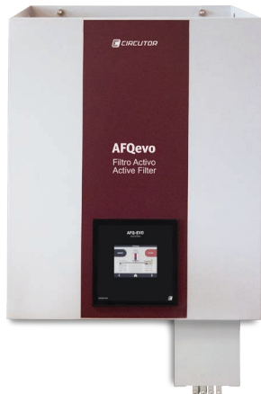
AFQevo con filtro EMI (WF)